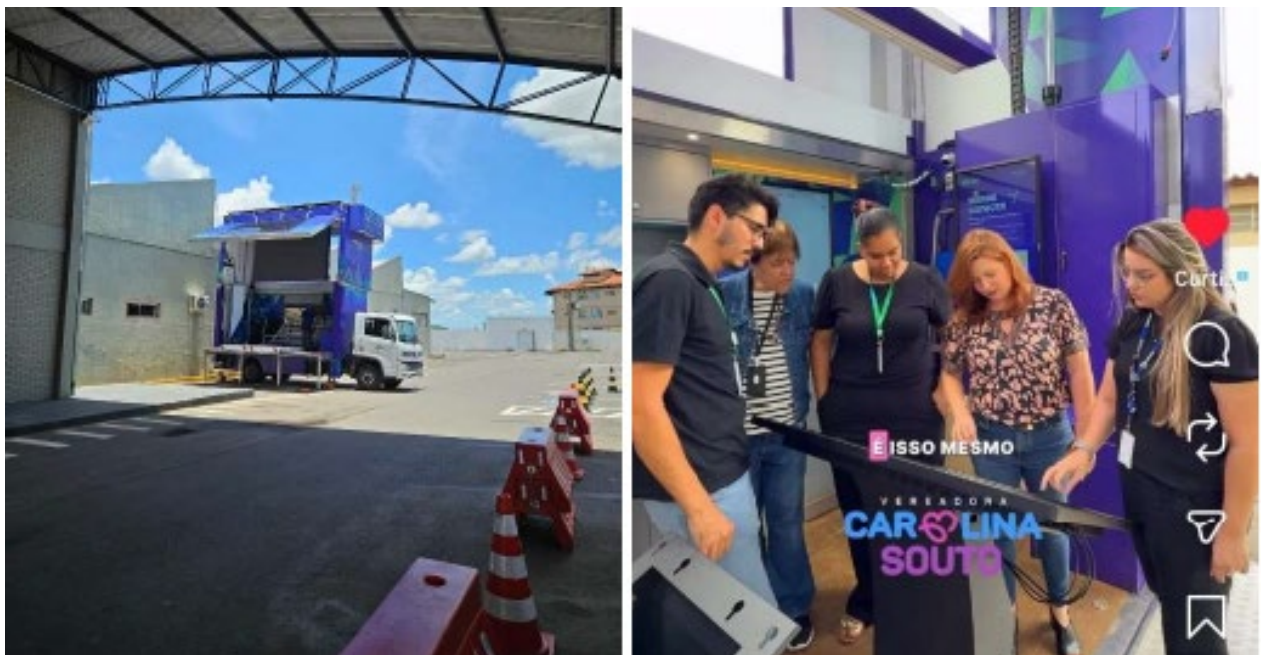
Registro da carreta do Sebrae que prestou atendimento ao público no estacionamento do Senai entre os dias 16 e 17 de janeiro.