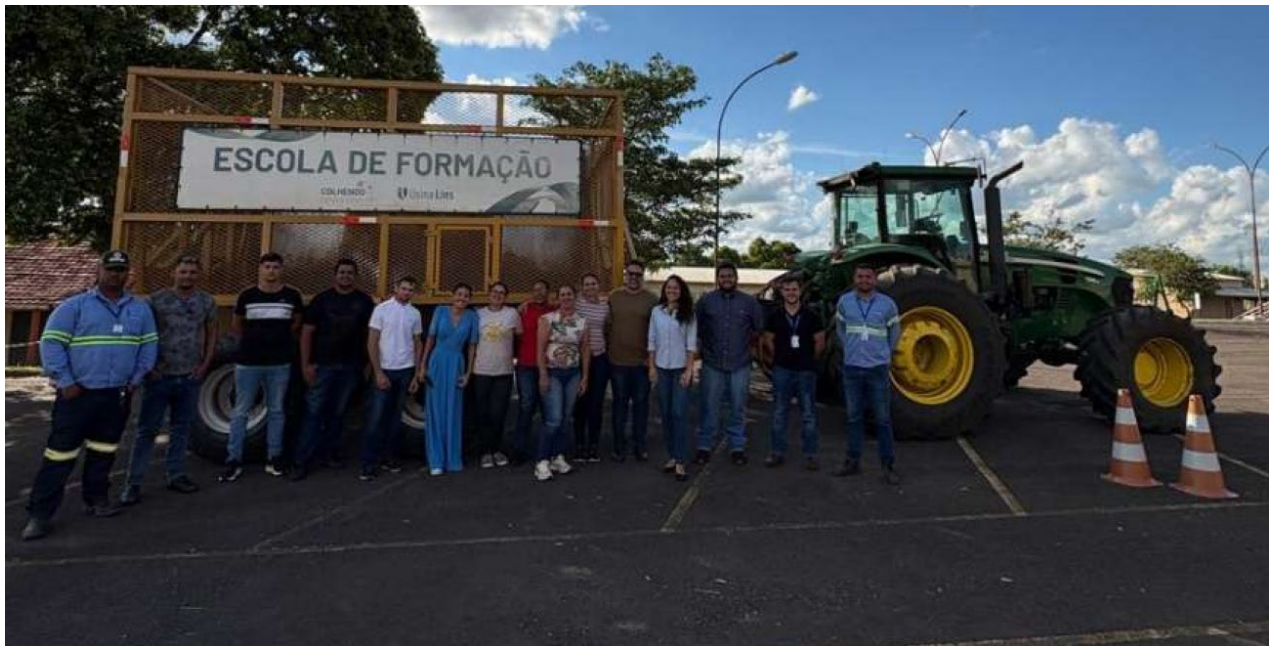
Conclusão do curso de Operador de Máquinas Agrícolas, para 2 turmas.