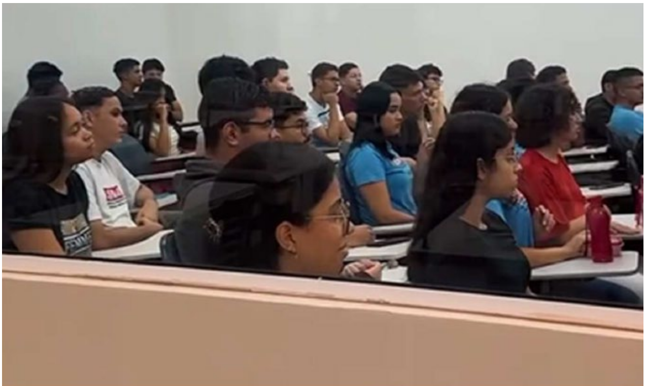
Registro das aulas inaugurais para as novas turmas.